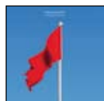
INDIE / BRITPOP

In ihrer Heimat sind sie bereits Superstars, nun sind die vier Australier nach Berlin gezogen, um auch die alte Welt zu erobern. Eine Tournee mit