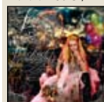
ZOMBIE PORNO METAL

Manchmal kommen sie wieder. So der Titel einer Kurzgeschichte von Stephen King, in welcher der Hauptdarsteller von den toten Mördern seines Bruders heimgesucht wird. Ähnlich gruselig