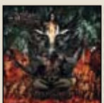
SUPREME DEATH METAL

WALPURGIS RITES – HEXENWAHN NUCLEAR BLAST / WARNER