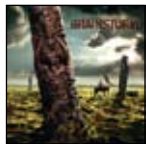
POWER METAL MIT GROSSEM P

Live gehören Brainstorm zu meinen absoluten Lieblingen. Weil die Schwaben hervorragende Musiker sind, vor allem aber, weil sie mit